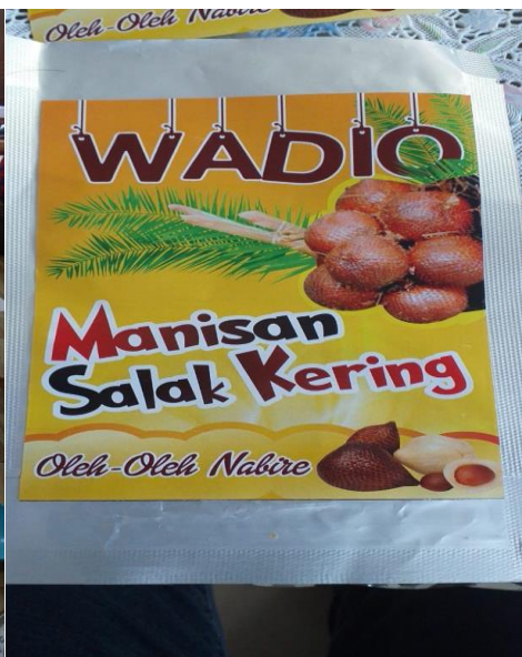
Gambar 5. Foto Pelaksanaan Pembuatan Manisan Salak dan Kemasannya