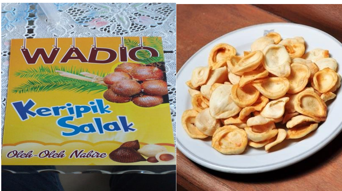
Gambar 7. Foto Kemasan dan Hasil Penggorengan Kripik Salak

Setelah kegiatan praktek dalam membuat manisan salak, manisan kering salah dan kripik salak, dilanjutkan dengan pengisian kuesioner evaluasi pelaksanaan kegiatan pengabdian kepada masyarakat.