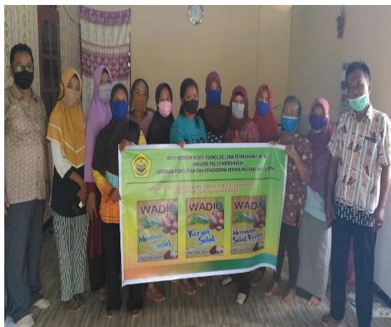
Gambar 2. Foto Bersama Peserta Pelatihan