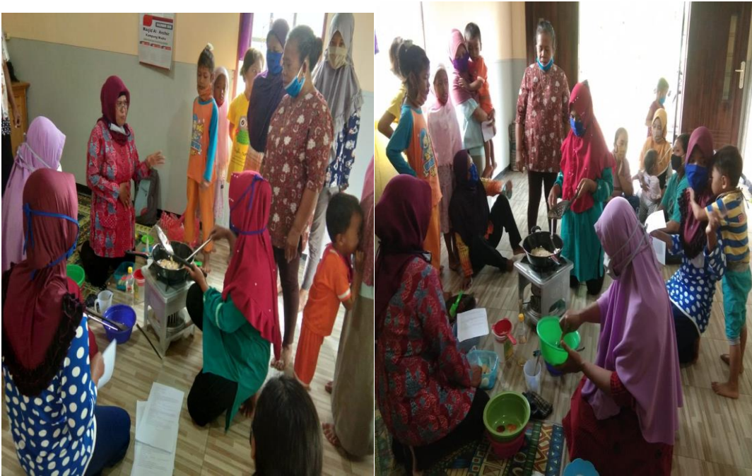
Gambar 6. Foto Pembuatan Kripik Salak