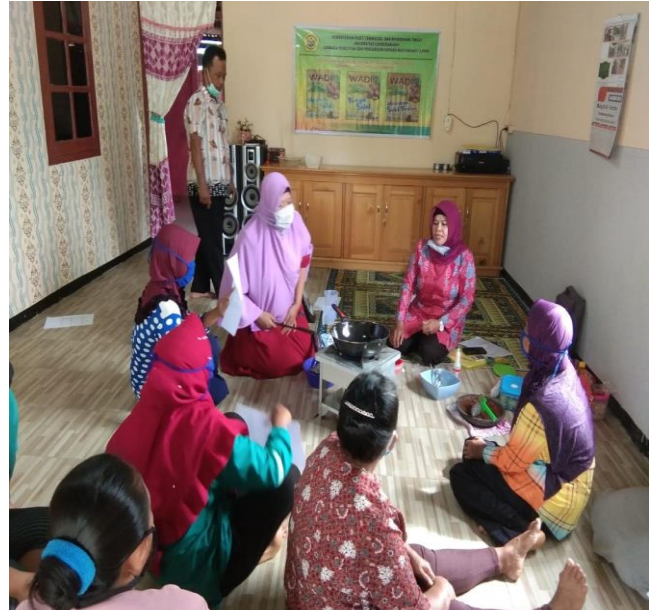
Gambar 3. Foto Persiapan Pembuatan Manisan