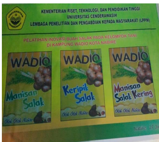
Gambar 1. Foto Kegiatan Pelatihan